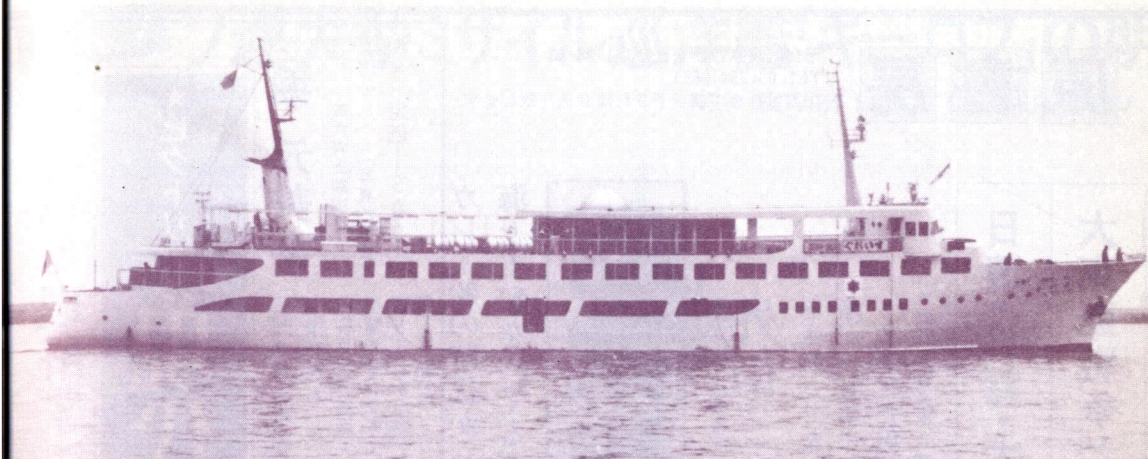
関西汽船の阪神～高松航路客船くれない丸。1963年に三菱下関で建造。1,060総トン、航海速力15.6ノット。(野間 恒)