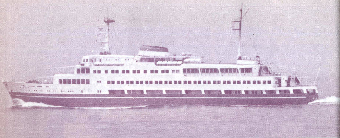
関西汽船の阪神～松山航路客船くれない丸 (2,988総トン)。別府航路のフェリー化に伴い現航路に転配された。(野間 恒)