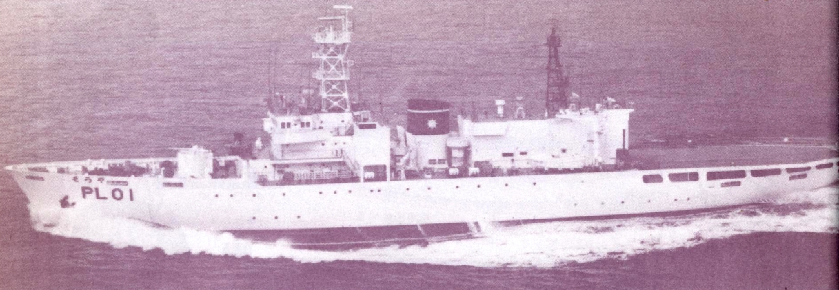
海上保安庁ヘリコプター搭載巡視船の第1船“そらや”。常備排水量3,803トン。日本鋼管鶴見造船所で昭和53年11月22日竣工。