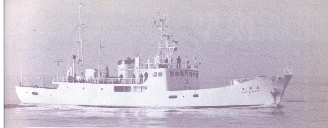
若狭湾における気象庁函館海洋気象台の海洋気象観測船高風丸。345総トン、1963年竣工。(井上 孝司)