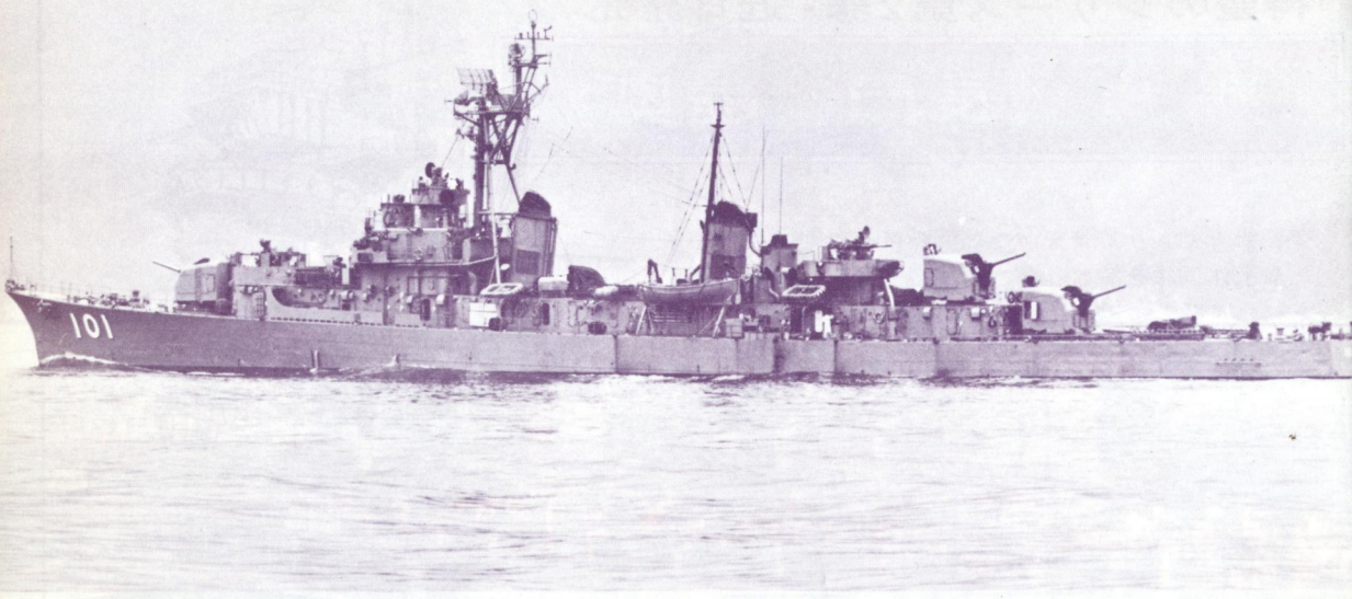
護衛艦「はるかぜ」(1956年竣工)。現在は第1潜水隊群所属で、定係港は呉。