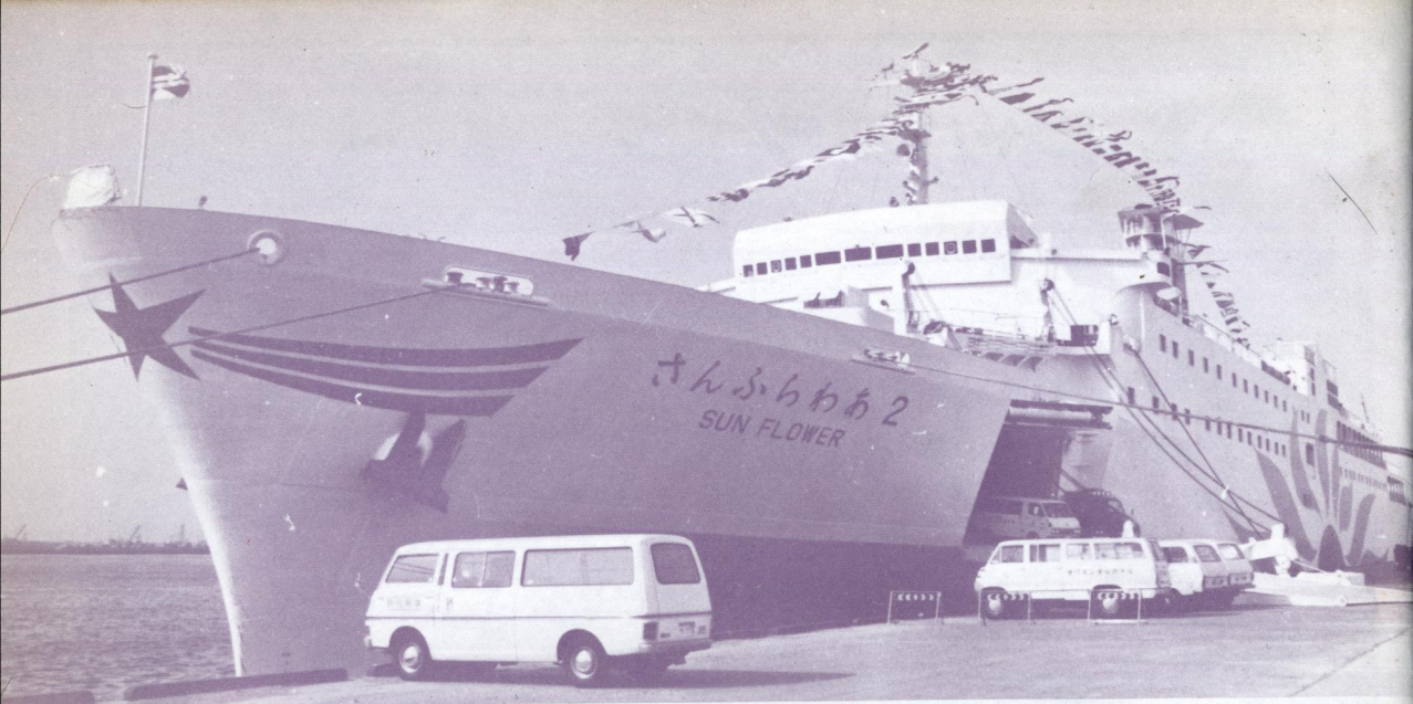
3月から大阪南港～苅田間に就航した大洋フェリーの“さんふらわあ2”。新しい船首のマークに注意。(井上 清明)