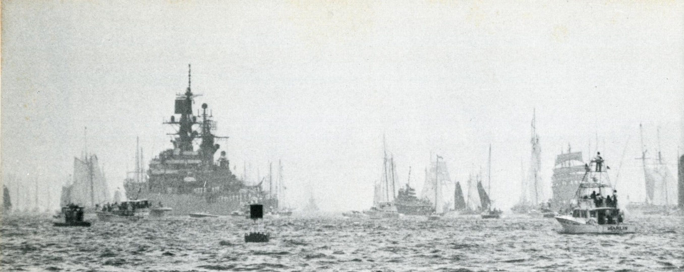
ハドソン河を下航しながら観艦式参加艦艇を観閲中の観閲艦ウェンライト(米ミサイル巡洋艦)。