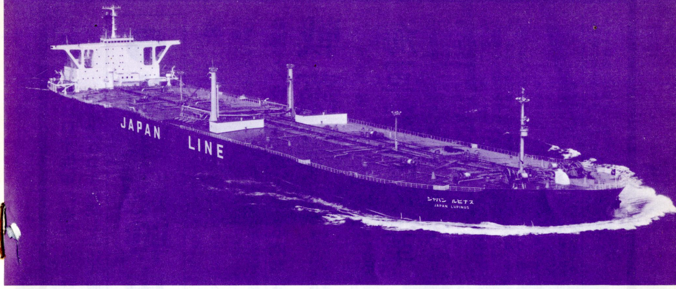
ジャパン・ラインのタンカー“ジャパン・ルピナス” Japan Lupinus。日立造船堺工場で7月26日竣工した235型標準船である。