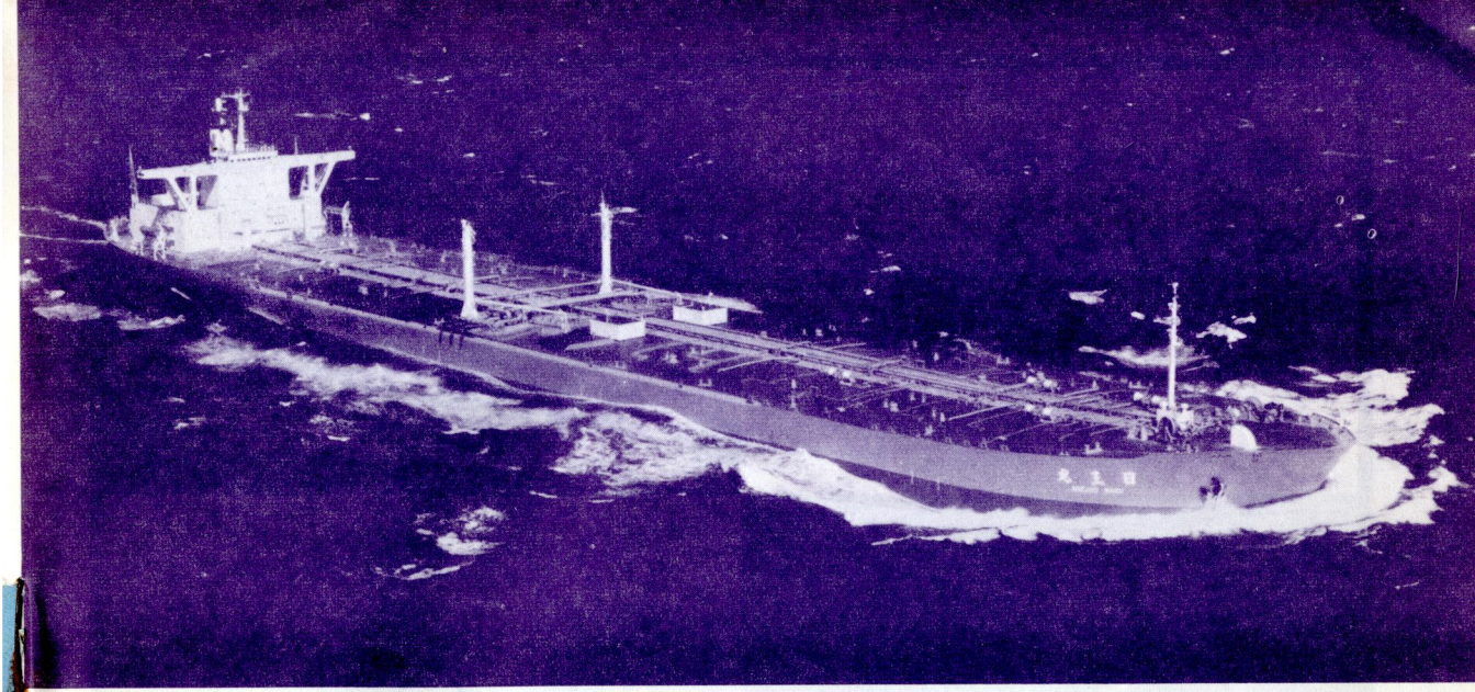
山下新日本汽船・日正汽船共有の大型タンカー日王丸。日立造船堺工場で3月15日竣工。238,731重量トン。