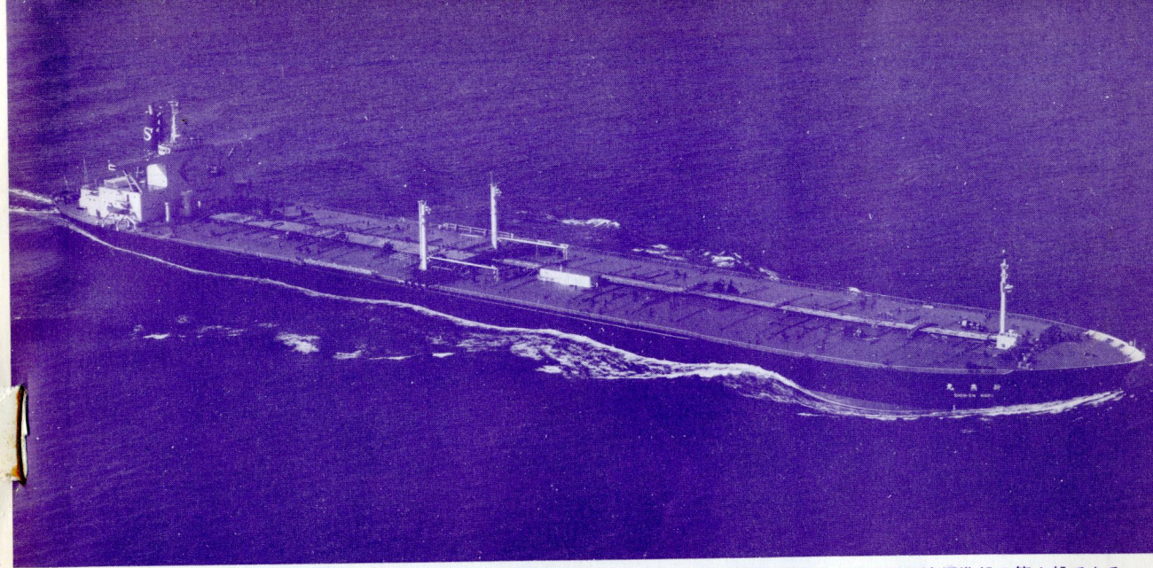
新和海運の油槽船新燕丸。日立造船堺工場で昨年11月8日竣工。日立造船が開発した235型経済標準船の第1船である。