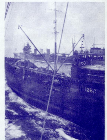
アリエンシャン作戦で、洋上補給中の給油艦「日本丸」。満腹して離れて行くのは軽巡洋艦「阿武隈」

東京都文京区後楽1-5-3 TEL (811) 3318・2807 振替(東京)26555