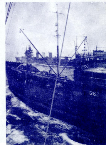
アリニューシャン作戦で、洋上補給中の給油艦「阿武隈丸」。満腹して離れて行くのは軽巡洋艦「阿武隈」

東京都文京区後楽 1-5-3 TEL (811) 3318・2807 振替(東京)26555