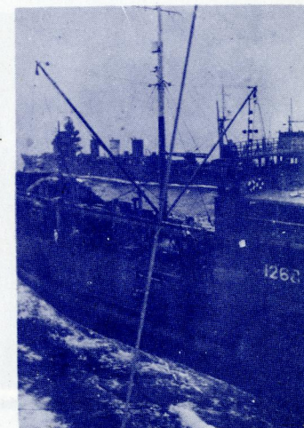
「阿利ユーション」作戦で、洋上補給中の給油艦「阿武隈丸」。満腹して離れて行くのは軽巡洋艦「阿武隈丸」。

東京都文京区後楽 1-5-3 TEL (811) 3318, 2807 振替(東京)26555