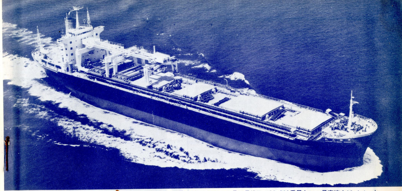
大阪商船三井船舶のチップ運搬船中越山丸。三井造船玉野造船所で7月29日竣工，28,210重量トン，最高速力16.4ノット。