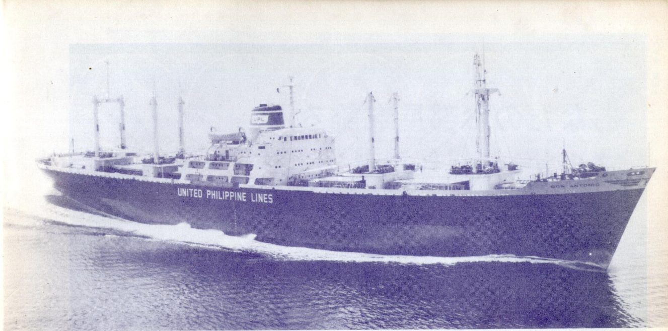
パナマ向け輸出貨物船ドン・アントニオ。昨年8月31日三菱重工広島造船所で竣工。12,286重量トン、満載航海速力18.3ノット