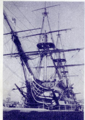
今も現役艦としてポーツマスに保存されているピクトリー