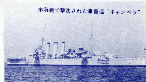
本海戦で撃沈された濃重巡“キャンベラ”

〈艦船画募集〉 現在企画中の艦船画集のため、読者の作品を募集します。サイズはB6判(本誌の半分)、ペン画、黒インク使用。採用分は薄謝を呈します。振って御応募下さい。