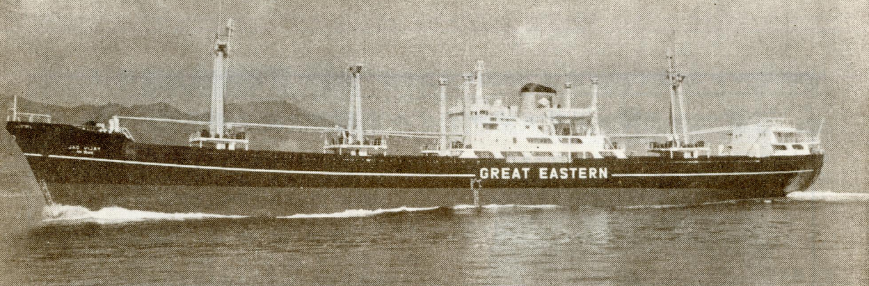
インド向け貨物船“ジャグ・ヴィジャイ” Jag Vijay。日立造船因島工場で2月15日竣工。10,678 重量トン、14.5 ノット