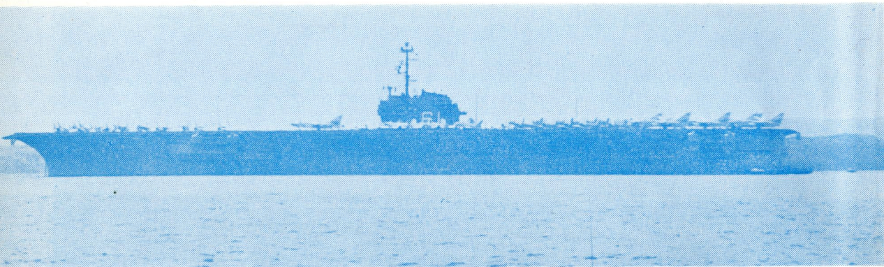
佐世保港における米空母レンジャー Ranger CVA-61。左舷正横からの写真で、その壮大な構造美が印象的だ……